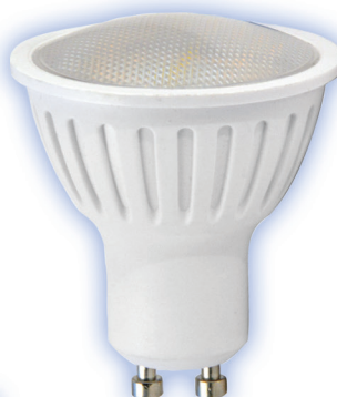
XL JDR 5W GU10